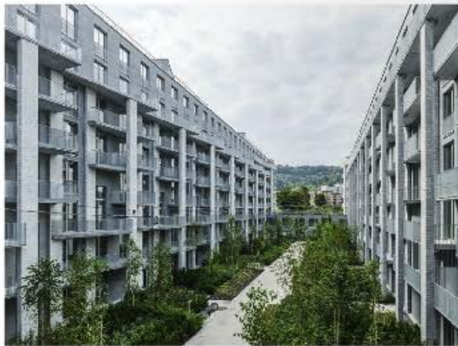
Der Südhof: Der Ankunftsort der Bewohner ist ruhig, grün und weiss.