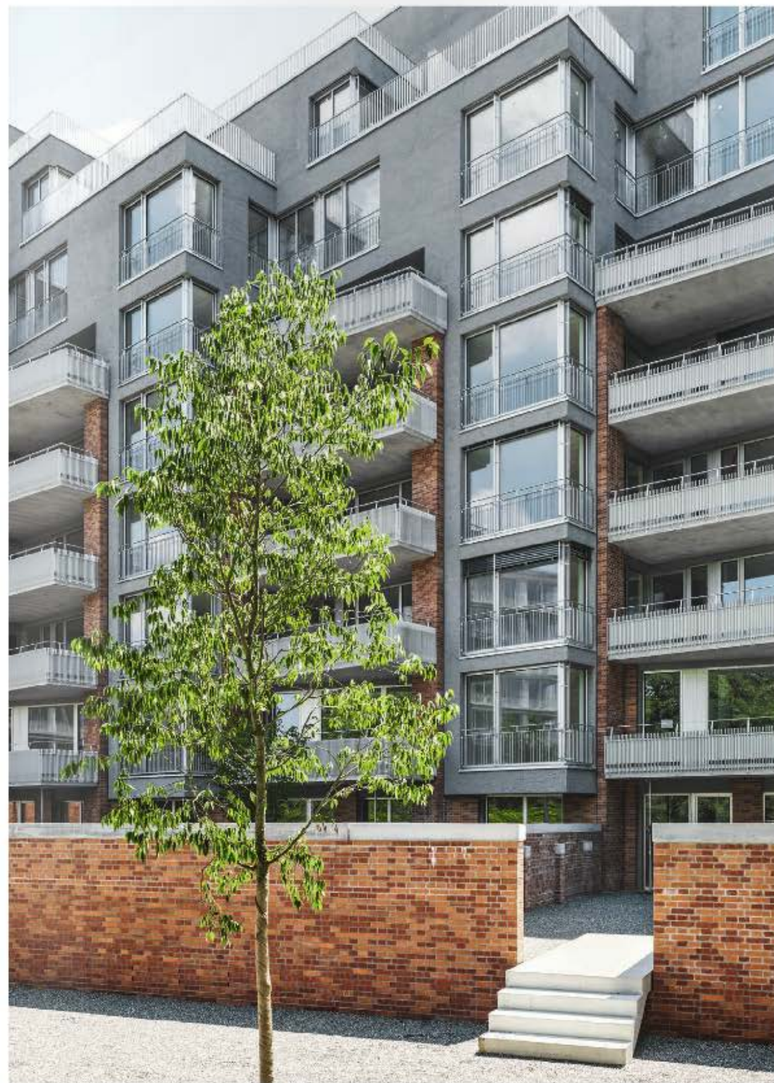
Wie monumentale Sägeblätter fressen sich die achtgeschossigen Zackenzeilen durch den Stadtraum und lenken die Blicke der Bewohner in den Landschaftsraum des Üetlibergs.

Mit dem Problem der Nähe kam die Genfer Wohnzelle in Miremont-le-Crêt auf den Entwurfstisch. Interessant sind heute vor allem die Unterschiede zu Marc-Joseph Saugeys Projekt aus den Fünfzigerjahren: Beim Einzelbau in Genf erfasst die Überlagerung zweier Ordnungen den gesamten Grundriss. Dahinter stecken einerseits streng moderne Vorstellungen über Himmelsrichtungen, andererseits fällt durch die gezackte Fassade grosszügig Tageslicht in die vierspännig organisierten und einseitig orientierten Kleinstwohnungen. Das Zürcher Zeilenpaar →