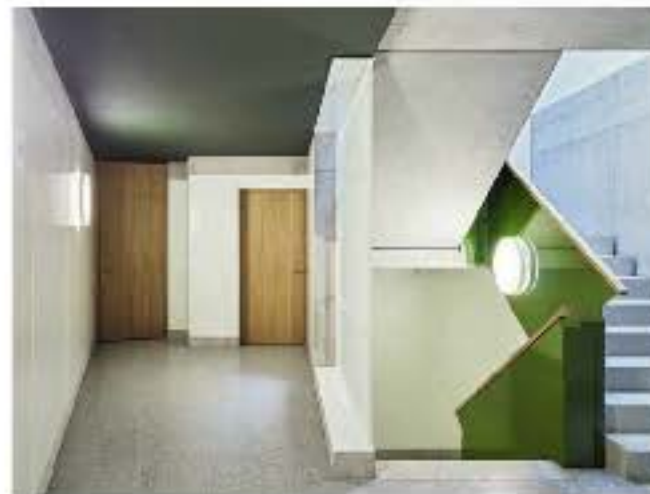
Das Treppenhaus: viel Gestaltung für wenig Geld.

→ dagegen bildet mit zwei geräumigen Durchschusswohnungen pro Treppenhaus eine symmetrische Komposition. Dabei folgen die Individualzimmer nach innen der Grundordnung, währenddem sich die Hauptwohnräume in die Weite ausdehnen.