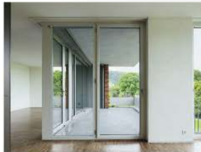
Die Hauptwohnräume: Die Ausdehnung orientiert die Wohnungen aneinander vorbei und in die landschaftliche Tiefe stellt zum Gegenüber.